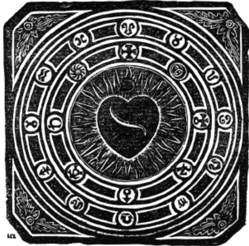
Gravure de L. Charbonneau-Lassay reproduisant le marbre astronomique de Saint-Denis d'Orques. ( Études de symbolique chrétienne , T. I, p. 188)

début du XVIII e siècle (l'une est précisément datée de 1708) qui, conformément à la tradition chrétienne relative au Zodiaque (le « porte-vie »), envisagent le Sacré-Cœur comme formant par excellence le centre de l'univers 9 . Le culte du Sacré-Cœur ayant connu une impulsion décisive à la fin du XVII e siècle, puis en 1720-1721 avec la peste de Marseille, il n'est rien d'étonnant d'en trouver un témoignage. Notons cependant que son emploi ici, à Marseille, précède le développement du culte liturgique.