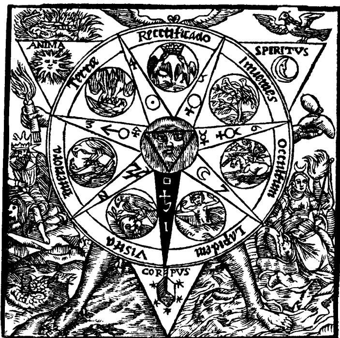
Gravure extraite d' Azoth... , p. 179.

Toute cette emblématique est caractéristique des traités d'alchimie du XVII e siècle. Nous reproduisons ici à titre d'exemple une figure extraite d'un des classiques du genre, Azoth, ou le moyen de faire l'Or caché des Philosophes , de Basile Valentin, d'après l'édition de Paris, 1659. Le lecteur y retrouvera la plus grande partie des symboles présents sur la pierre de Louis Meifredi.