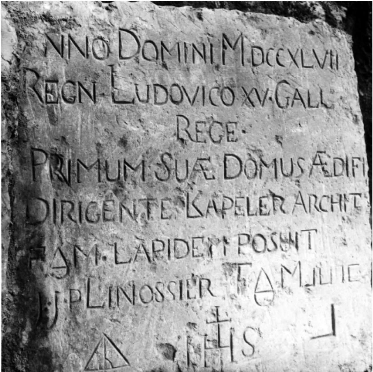
Dalle n° 91880 de l'inventaire, cliché n° 43217.